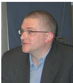
reż. Grzegorz Braun